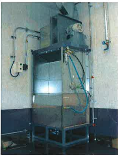
調色・小型部品用