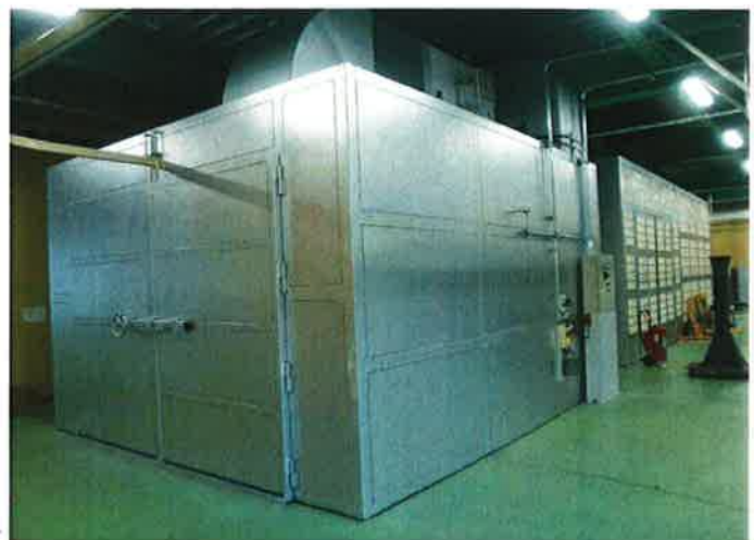
走行レールを使った塗装工程との組合せ例

その他にもご要望に応じて、ご提案いたします。詳しくは当社、営業担当までご連絡ください。